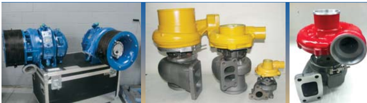
L'entreprise est située dans un local de 6000 pieds carrés et elle vient d'investir 100 000 dollars pour l'achat d'équipement de pointe afin de répondre à une demande grandissante.