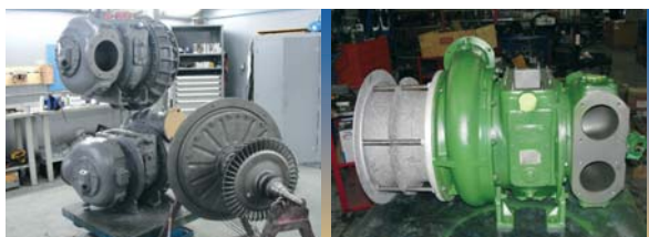
Turbo Expert répare tous les turbos, du plus minuscule (celui de la voiture Smart) aux plus gros avec un savoir-faire unique.

Turbo Expert offre un savoir-faire unique au Québec. La réparation de turbos, par rapport au prix d'un neuf, est très économique (environ 50 pour cent moins cher) et souvent plus rapide, surtout quand elle est effectuée par des professionnels. « Selon mes sources, rigole Yves Grondin, je suis le plus vieux spécialiste de la réparation de turbos au Québec. » Vérifications faites, ses sources semblent fiables.